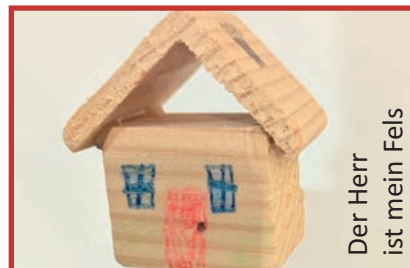
Der Herr ist mein Fels