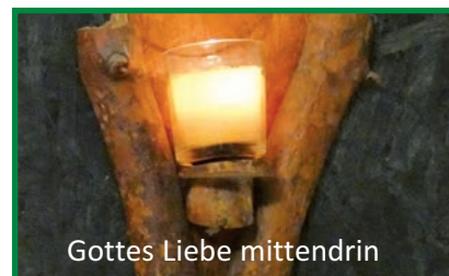
Gottes Liebe mittendrin